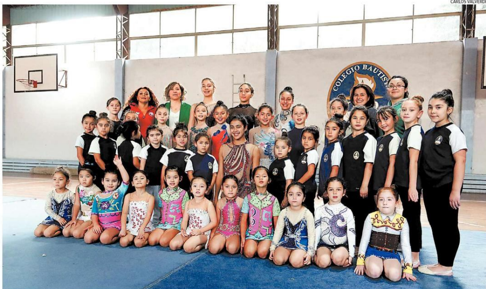
Alumnas de distintos niveles forman el grupo de gimnasia rítmica del Colegio Bautista de Temuco.

PROYECTO ESTÁ DIRIGIDO A DAMAS DESDE LOS 5 AÑOS