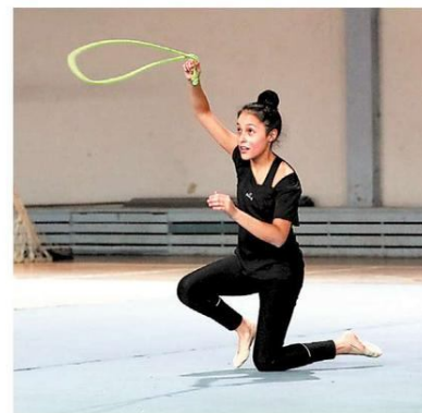
Concentración absoluta exhiben las deportistas en las prácticas.

"Lo más importante es el trabajo formativo. Los re-