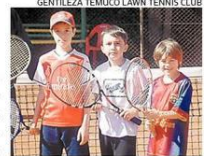
RECIBE A NUEVOS JUGADORES.

● A la escuela de tenis del Temuco Lawn Tennis Club le interesa ampliar sus filas. Para cumplir su objetivo, la institución abrió nuevos cupos especialmente dirigidos a estudiantes desde los cinco años. Los interesados en sumarse al grupo deben hacer las consultas en las instalaciones del club (Phillippi N°636) y en el fono (45) 2981847.