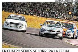
EN CUATRO SERIES SE CORRERÁ LA FECHA.

● Más de 50 pilotos se esperan en la segunda fecha del Campeonato de Automovilismo Chile Sur. La etapa se vivirá el 15 de abril en el autódromo Interlomas y reunirá a pilotos de Santiago al sur. En la jornada participarán deportistas de las series Turismo 600, Turismo Sur 1.600 Turismo Sur 2.000 y Fórmula 3 Chile Sur.