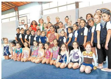
LA SELECCIONADA COMPARTIÓ AYER CON LAS GIMNASTAS DEL BAUTISTA.

“Agradecemos el apoyo constante de la Municipalidad de